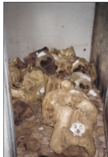
Ces crânes proviennent d'animaux chassés dans le Parc National. Il arrive que l'on trouve également d'autres victimes.

La Commission Européenne a contesté ces points et a même souligné une possibilité accrue de contrôle du braconnage du fait d'un système routier amélioré ! Les protestations des organisations de protection de la nature, à l'échelle internationale, ont conduit à l'arrêt de ce projet pour des raisons écologiques, mais provisoire seulement!