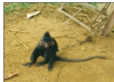
Capturé jeune - utilisé comme jouet - condamné à finir dans une casserole: Cercocèle noir.