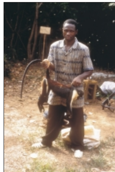
Un cercothèque de Diane abattu est vendu en Côte d'Ivoire.