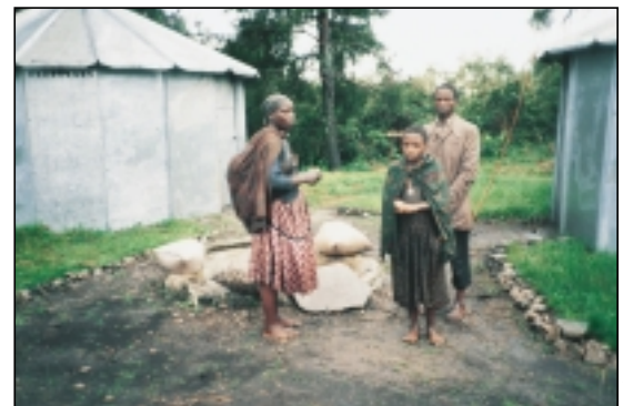
La faim est leur pire ennemi.