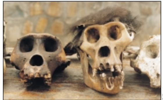
De nombreux gorilles habitués à la présence des hommes ont été tués en RD Congo.

Avec la vague de réfugiés venus du Rwanda voisin en 1994, quelque 750 000 personnes se sont installées en très peu de temps dans les régions protégées où vivent les gorilles. Les distances minimales avec les parcs n'ont pas été respectées. Dans la région des Virunga, le chaos a entraîné le déboisement de la moitié des réserves de bambous, l'une des principales ressources alimentaires des gorilles des montagnes. Le nombre de collets posés par les braconniers a également augmenté, tout comme la demande en bébés gorilles émanant de commerçants étrangers. Depuis 1997, la région est ravagée par la guerre civile. Le personnel des parcs nationaux n'est plus du tout payé depuis lors. Les milices ont fait main basse sur l'équipement des gardes forestiers et leur armement a été réquisitionné par l'armée, si bien qu'ils sont souvent dans l'incapacité de s'opposer aux bandes de braconniers souvent très bien armés et organisés.