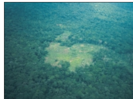
Les bovins et autres animaux domestiques sont également menés aux pâturages dans le parc national de manière illégale.

Dans de nombreuses régions tropicales, l' élevage de bovins et d'autres animaux de boucherie est rendu impossible par la présence de parasites, de mouches tsé-tsé en particulier.