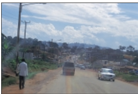
Kampala, capitale de l'Ouganda, enregistre la plus forte croissance démographique du pays.

En comparaison à l'Allemagne, où le taux de natalité est en recul et le nombre d'habitants par conséquent stable, la croissance démographique en Afrique centrale et occidentale, avec un taux de 2,5 à 3%, est extrêmement élevée. Un meilleur accès aux soins médicaux a permis d'enrayer le taux de mortalité, toutefois les attitudes religieuses et culturelles ne permettent pas un contrôle des naissances efficace. Cette évolution entraîne généralement la dégradation des conditions de vie.