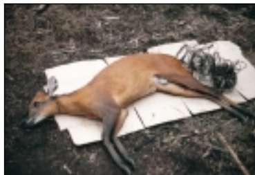
Céphalophe à front noir pris dans un collet.

Les espèces de grande taille ou facilement repérables sont les premières victimes. La plupart sont des ongulés et des rongeurs. En Guinée-Équatoriale, les rongeurs représentent 32% de l'offre; au Liberia, les céphalophes constituent 75% du gibier vendu.