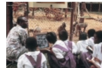
L. Gadsby/P. Jenkins

La Berggorilla & Regenwald Direkthilfe (Aide directe aux gorilles de montagne et à la forêt tropicale) finance et équipe les gardes qui travaillent dans le parc national où vivent des gorilles. L'acquisition de terres, les ateliers pédagogiques et l'engagement dans des initiatives locales supposent des aides financières.